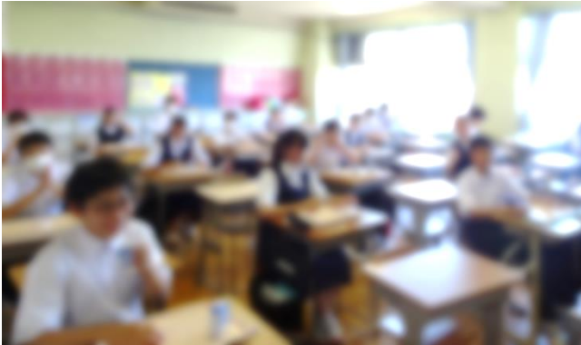
分散登校日の給食のようす

班ごとに向かい合って楽しく食事をすることはまだできませんが、久しぶりの給食を、皆おいしそうに食べています。