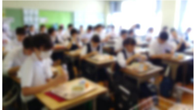
通常登校日の給食のようす