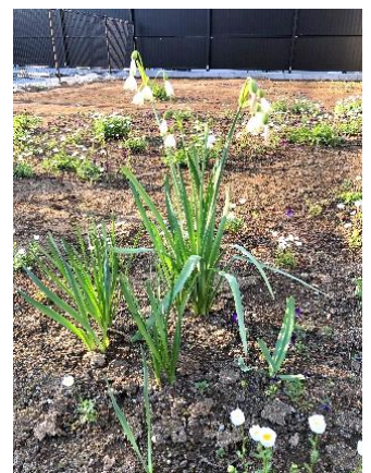
スノーフレイク 花言葉：清らか

世の中の動きは日々変化し、新型コロナウイルスへの対応は、まだまだ油断は許されない状況です。だからこそ御家庭と学校で子どもたちを支えていくことが大切です。何か心配なことがございましたら遠慮なく学校に御相談ください。私たち教職員は、すべての子どもたちが卒業の日を迎えるまで子どもたちの成長を願い、誠実にそして心を入れて教育にあたって参ります。どうぞ今年度も、本校の教育研究活動に御協力・御支援を賜りたくお願い申し上げます。