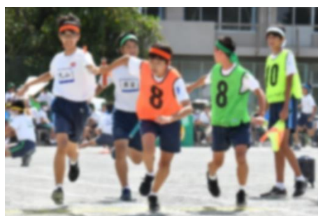
男子スウェーデンリレー