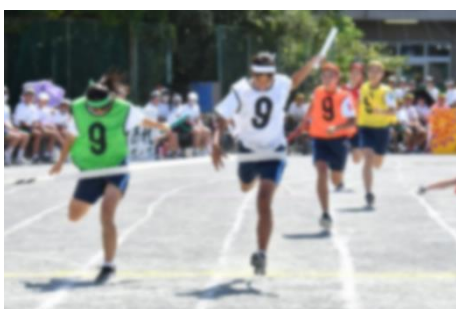
女子スウェーデンリレー